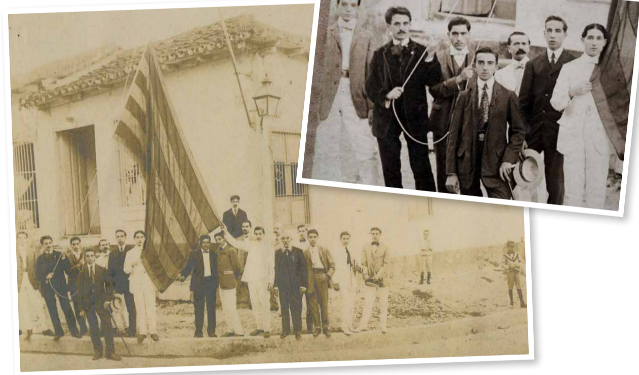
↑ Fundadors del Catalunya.Grop Nacionalista Radical de Santiago de Cuba.