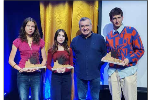
↑ Els guanyadors del Premi Josep Carbonell i Gener amb el president del GES.

El passat 28 de novembre en el marc de la Nit de Premis Sitges foren entregats els premis als guanyadors del Premi Josep Carbonell i Gener en la seva 43ena convocatòria.