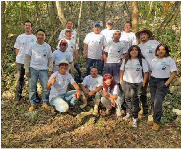
↑ Figura 5. Tot l'equip, el passat 2023.

Vam començar amb un plànol amb 22 construccions, i ara ja en té més de 100, d'altra banda hem pogut confirmar que