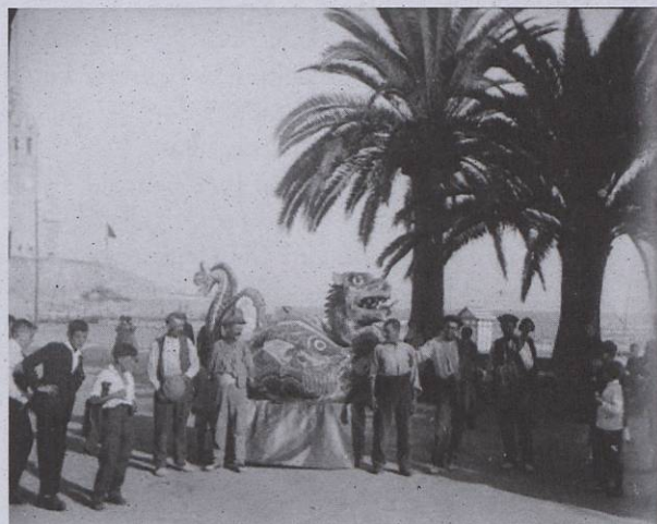
La fera foguera a la Ribera l'any 1922

La Fera foguera fou presentada el 23 d'agost, després