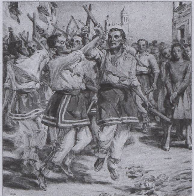
El Ball de bastons.

Per a anar seguint l'evolució històrica de la fera foguera , he estructurat aquest article en quatre parts. A la primera s'exposa breument la relació entre Ferrer Pino i la festa major. La segona recull els antecedents de la fera foguera , com són els dracs de fora de Sitges que van participar a la festa major abans de l'any 1922. La tercera es centra en la construcció de la fera foguera i la seva inauguració l'any 1922. I la quarta part vol ser una aproximació esquemàtica als canvis d'aspecte de la fera foguera abans de la restauració que es va fer