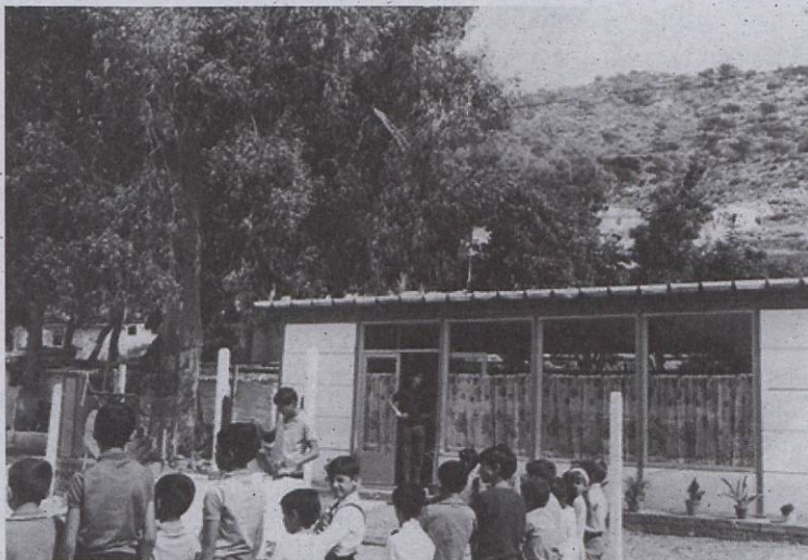
L'escola de la Tèrmac

A la dreta de l'entrada del poblat hi havia l'escola, en un mòdul prefabricat, on els nois i noies de la Tèrmac