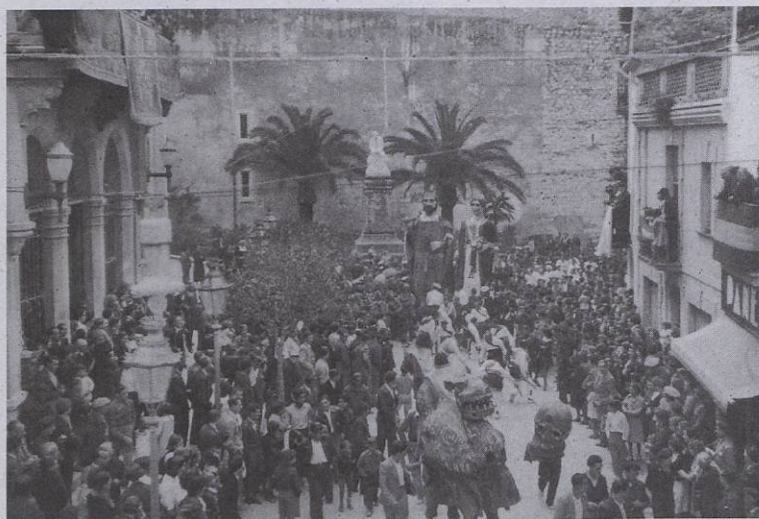
Sortida dels balls en el Corpus Christi de 1939

Com deia al principi, hi hauria tres possibles etapes