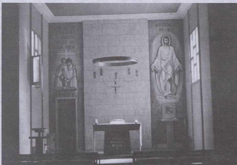
La capella del col·legi antic després de la reforma de l'any 1965