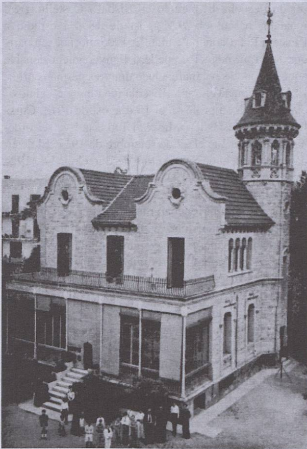
Vista del col·legi antic amb uns quants alumnes i uns escolapis

Aquesta, postura radical es comprovà en el moment de la votació. La Llei de Confessions i Congregacions religioses s'aprovà, doncs, sense excepcions el 2 de juny de 1933 i el seu article 30 deia: " Las órdenes y congregaciones religiosas no podrán dedicarse al ejercicio de la enseñanza ". L'Escola Pia, com la resta d'entitats de religiosos, va quedar sense poder exercir el seu ministeri tradicional, per al qual havia nascut.