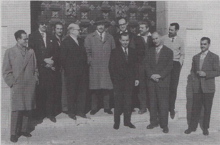
Primera Junta del Sitges Foto-Film l'any 1959