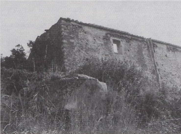
La casa de la Morisca cap als anys 1970