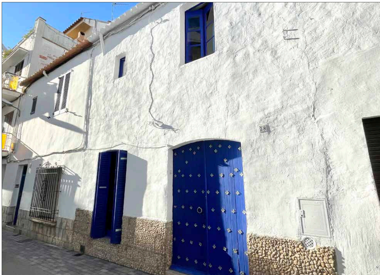
↑ Can Maleno del carrer de Sant Sebastià.