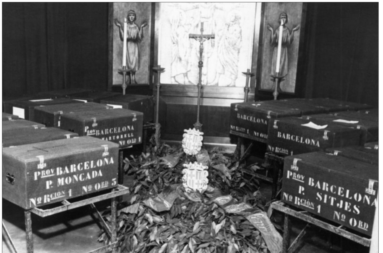
Restes a punt de ser trasladades al Valle de los Caídos, 23-4-1959.