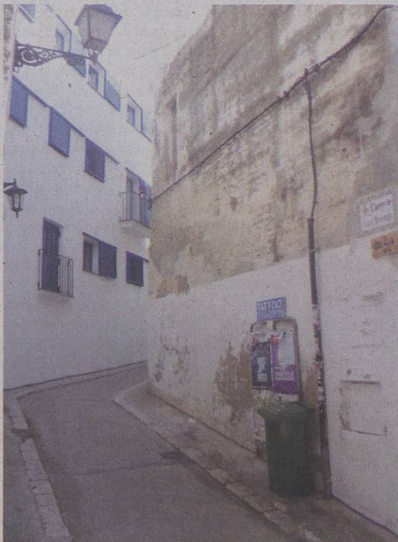
El carrer de Sant Domingo, abans carreró d'en Lluç