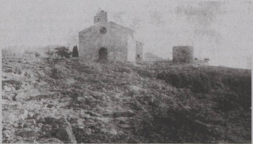
Sant Sebastià i al seu costat el Molinot en el segle XIX