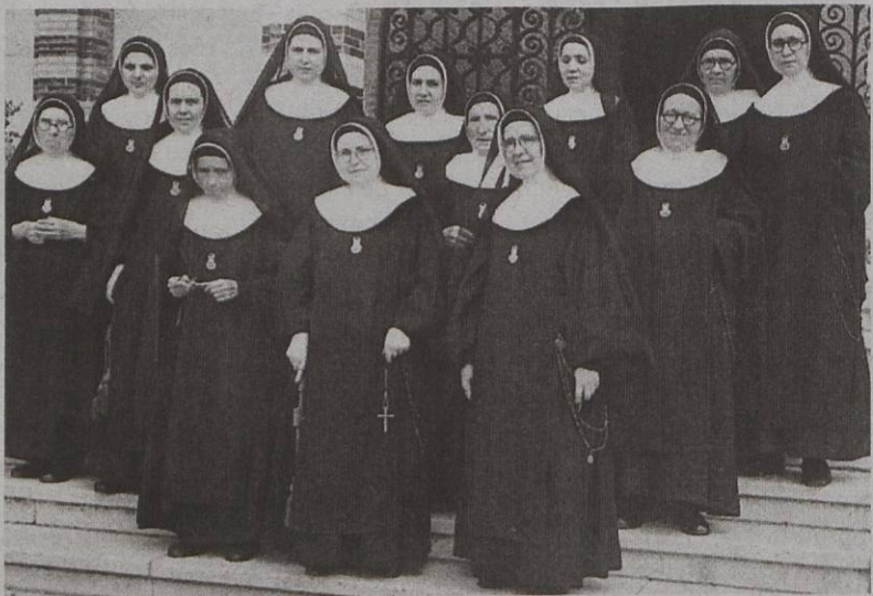
La comunitat de Monges Concepcionistes de l'Hospital de Sant Joan Baptista cap els anys 60

El 24 d'agost de 1989 es va tornar a posar al saló de Plens la placa dedicada al doctor Robert, que havia estat tret del saló l'any 1939 83 . No es va posar, però, la placa amb el text que havia tingut anteriorment, sinó una altra amb només el nom del doctor Rober igual a totes les altres que hi havia a la sala. El 8 de setembre de 1992, va ser Rafael Casanova i Termes el nomenat fill predilecte 84 , i el 23 de setembre de 1992, dia de