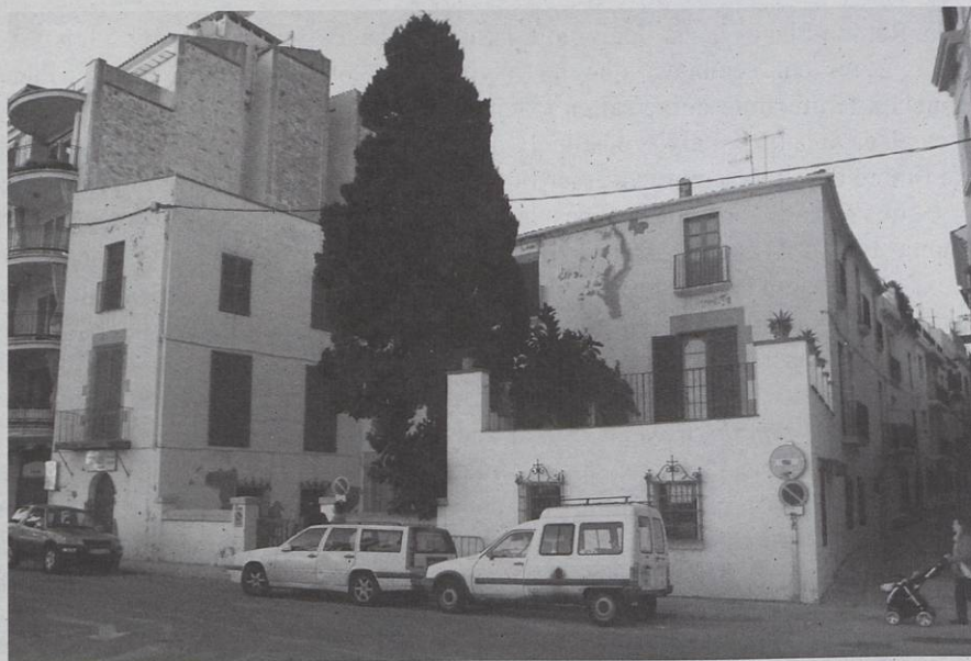
Can Falç, a baix-a-mar, i al seu costat el carrer de la Carreta

Manuel Falç i Almirall que hem esmentat més amunt, declarava, en el cadastre de 1716, ser propietari de 13 jornals de malvasia, 2 jornals i mig de vinya blanca, mig jornal de camp erm amb alguns garrofers, 35 jornals de muntanya i una casa amb corral a la partida de l'Aiguadolç; 3 jornals i mig de vinya blanca de segona qualitat, mig jornal de vinya negra i 10 jornals