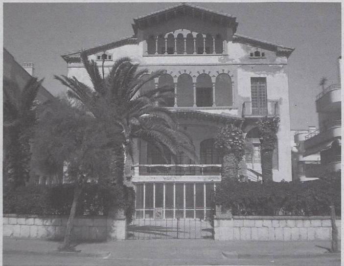
Can Vilella en l'actualitat