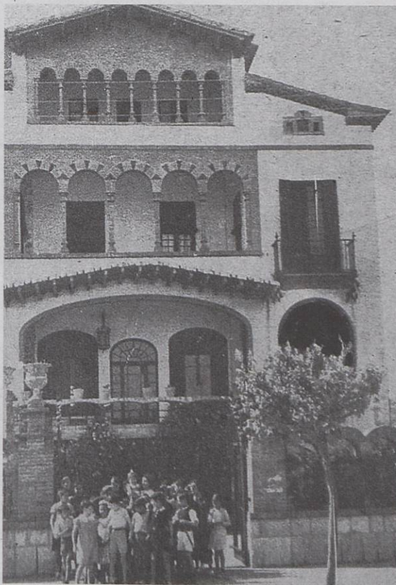
Can Vilella durant la guerra Civil amb un grup d'alumnes de la colònia, davant de la porta d'entrada

La relació entre sitgetans i refugiats no va ser idíl·lica ni exempta de conflictes de convivència. De conflictes, n'hi va haver en molts aspectes, però gai-rebé sempre amb un denominador comú, l'abastament de béns de primera necessitat, problema que s'intentà solucionar com