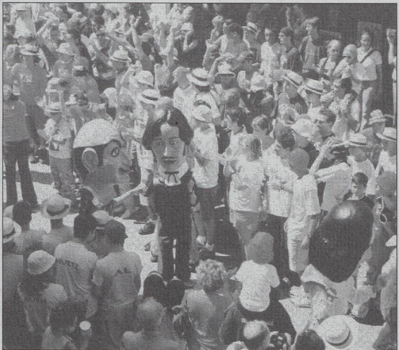
Els nans de Sitges a la plaça de l'Ajuntament l'any 2002

c) I per últim hi ha el tercer grup, format pels conjunts de nans i capgrossos irregulars, de caps fets en sèrie, que són, òbviament els més difícils de definir des de punt de vista d'espectacle. En aquest sentit s'ha d'intentar que en les festes els capgrossos tinguin també el seu paper, puguin executar la seva dansa i tinguin un cos, un posat i uns gestos en consonància amb