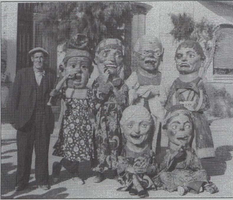
Els nans de Sitges l'any 1942

que, fabricats de cartró i procedents del País Valencià, porten noms de tipus populars: el Pagès, la Dama, el Tonto, la Vella, el Turc, la Criada, el Tricorni i el Curro. Pels anys 1960 se'n va fer donació a l'ajuntament i des de llavors han estat restaurats a fons en dues ocasions, 1982 i 1996. Actualment només apareixen en ocasions molt especials.