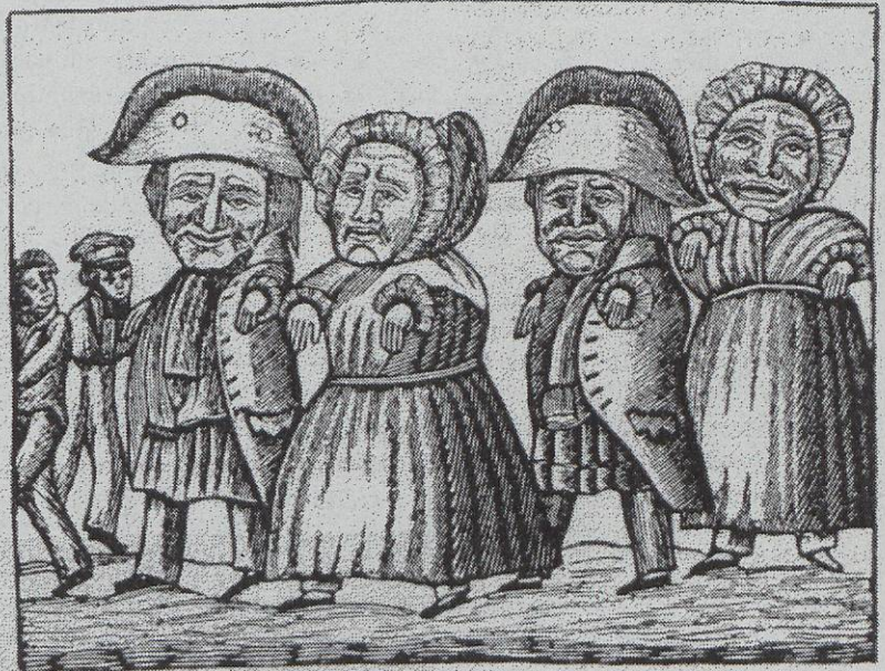
Dibuix que representa uns capgrossos del segle XIX

Per altra banda, les llargues cercaviles i processons, la incomoditat de portar durant molta estona un pes considerable i la manca d'un paper definit ha fet que sovint els capgrossos acabin sota el braç. S'acaba pen-