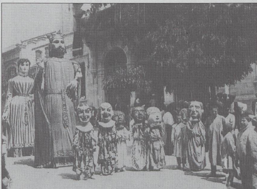
Nans i gegants de Sitges de principis del segle XX

Un dels trets més característics de la festa major de Vic és l'aparició dels Llúpies. Es tracta d'una estraforària família de capgrossos formada pel Merma, la Vella i el Nen, que representen el marit, la muller i un fill. Els dos homes van armats d'unes xurriaques amb les quals peguen la canalla que els surt al pas i els escri-