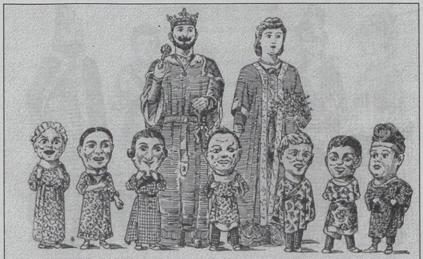
Dibuix dels gegants i nans de Sitges segons Joan Amades

En la festa major de 1978 l'Agrupació de Balls Populars de Sitges van estrenar una colla de vuit nans,