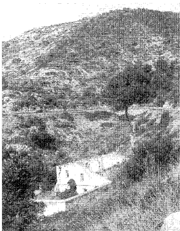
Vista de la Cala Morisca cap als anys 1970

Amb independència dels conreus, i atesa la situació estratègica d'aquell racó del Garraf, l'any 1787, el corregidor de Vilafranca, considerant la cala Morisca