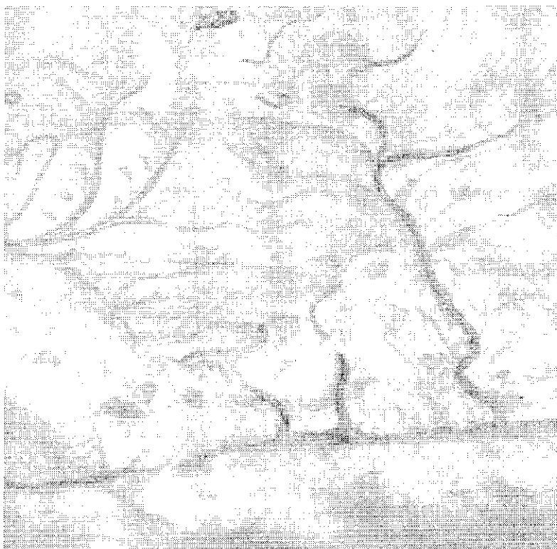
Un tros del mapa de Credeença del 1571 en el qual es veu com dibuixava ell l'orografia del Garraf. La taca que hi ha a l'extrem de dalt de tot correspon a la cocona Sivina

La cocona SIVINA o SAVINA: Cocona situada uns 300 m a l'ESE de Campgràs. Els mapes moderns la localitzen equivocadament al SO del puig de l'Olla. En els mapes de Credeença, al mig de la cocona hi ha dibuixat un tronc sec i mort de sivina. En el segon d'aquests mapes hi ha l'anotació explícita "tronc de savina" com a il·lustració de l'origen del nom.