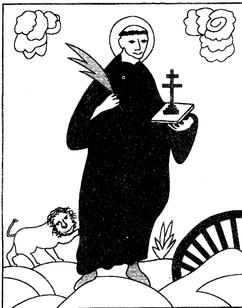
Dibuix corresponent a la imatge de sant Muç que hi ha a la capelleta de la casa del mateix nom

Passem a veure els atributs amb què se'l representa en el mosaic de la seva capella. El lleó simbolitza que es tracta d'un anacoreta, és a dir un home que portava vida piadosa en solitari en un lloc desert. En canvi l'hàbit i la tonsura indiquen que era religiós d'algun dels ordes religiosos existents, ordes que de fet no comencen a existir fins a l'edat mitjana, a partir del segle VI. El llibre i la creu de doble braç afegeixen la indicació que es tracta del fundador del seu orde: el llibre és el de la regla de l'orde escrita pel fundador i la creu és un atribut dels fundadors que comparteixen amb els