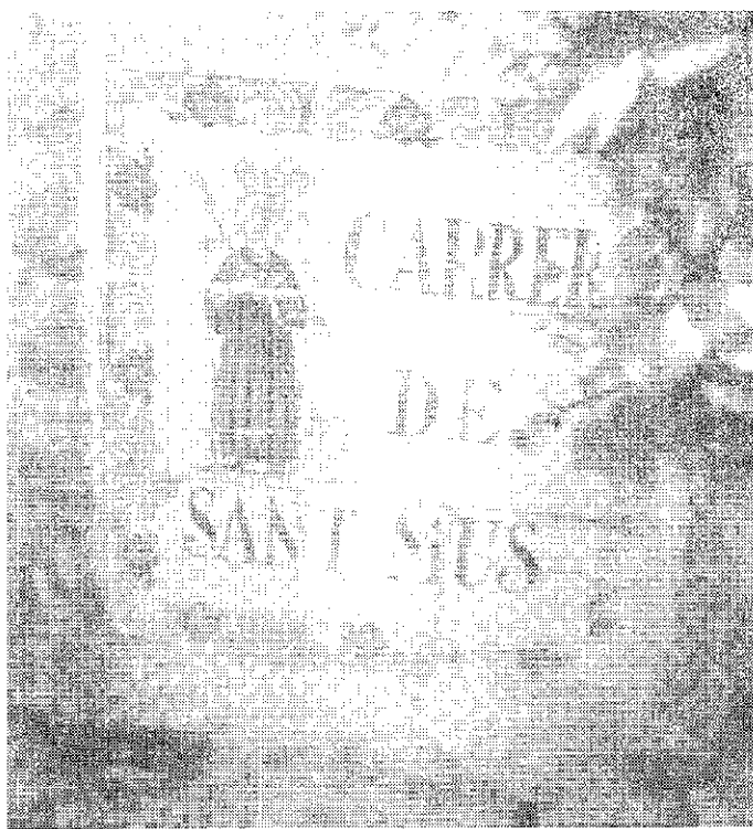
Placa amb el nom del carrer i el dibuix del sant que hi ha al començament del carrer de Sant Muç

Res d'aquest conjunt d'atributs correspon als sants Muç coneguts: tots ells pertanyen al temps de