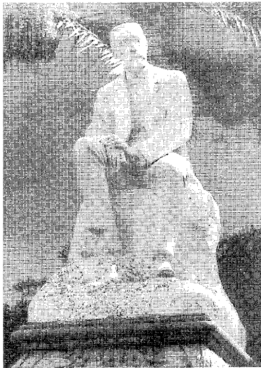
Monument de Sitges al doctor Robert

Penso que aquesta conferència hauria de portar un subtítol: " Bartomeu Robert i Yarzábal. Gran senyor de Sitges, massa oblidat de tots ". Aquestes paraules resumeixen el que jo penso del tractament que ha rebut la memòria del doctor Robert. encara que finalment sembla que Barcelona, i confio que Sitges també faci el mateix, commemorarà adequadament el seu centenari amb celebracions i homenatges de les entitats més representatives que hi ha a la ciutat, Generalitat, Ajuntament, Col·legi de Metges, Ateneu, etc.