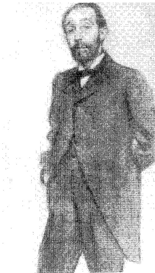
Retrat del Dr. Robert fet per Ramon Casas

El doctor moria prop de dos anys més tard, el 10 d'abril de 1902. La seva mort s'esdevingué al restaurant Prince, al carrer de Ferran, a on anà després de visitar el senyor Macaya, a qui va fer la seva última recepta, i després mossèn Jacint Verdaguer. El sopar havia estat organitzat en honor seu pels facultatius del cos mèdic municipal, i cap al final de l'acte li varen demanar que fes el brindis, però tan sols va poder dir: "Quan és el cervell qui dicta les seves paraules puc fàcilment dominar-me, però a vosaltres, estimats