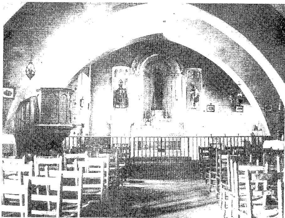
Capella de l'Hospital de Sant Joan amb l'altar major a principis del segle XX

seves filles. El 1870, de les set monges que integraven la comunitat de Sitges, quatre es dedicaven a tasques docents. Aquell mateix any, com ja hem dit abans, es construí un nou espai per a l'ensenyament de noies a la banda de ponent, amb entrada pel baluard de Santa Caterina i pel carrer de Sant Joan.