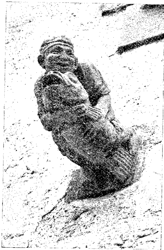
Gàrgola del Pescador. Maricel

Seguim avançant. A la finestra següent trobem una altra parella de capitells. Comencen els inspirats en les faules d'Iriarte, que Jou anava llegint en l'obra didàctica de Montlau «Elementos de Literatura o Arte de Componer